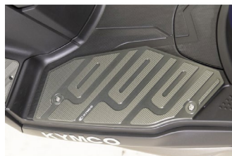
MARCHE PIED ALUMINIUM X-TOWN CT 125 KA-01-0659