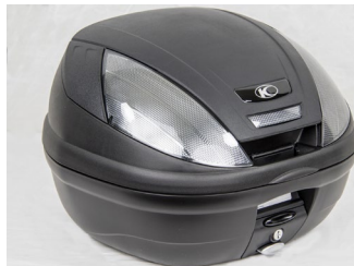
TOP CASE 39L KYMCO NOIR