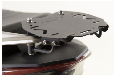
SUPPORT DE TOP CASE X-TOWN CT 125 KA-01-0660